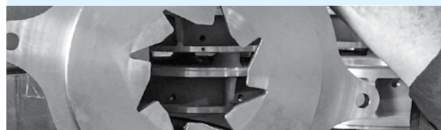
Placa de corte para fibras