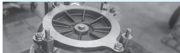
Extremo húmedo de metal para ampliar la vida útil de la bomba