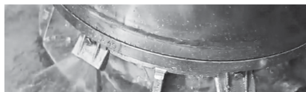
Barrera hidráulica para evitar que entren las fibras